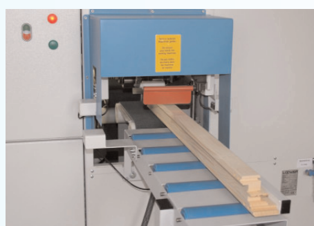
Berührungslose Werkstückbreiten- und Profilerkennung