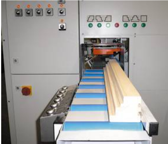
Standardprofilvorwahl per Taster mit 6 Grundprofilen