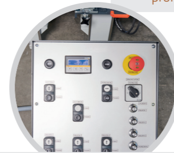
Frei positionierbares Bedienfeld Freely positionable control panel