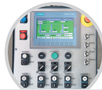
Datenanbindung und Scannerintegration Data connection and scanner integration