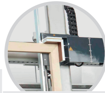
Eckverbindung Minizinken Corner connection mini tines