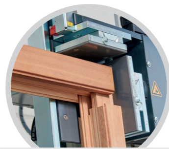
Eckverbindung Schlitz/Zapfen Corner connection slot/tenon