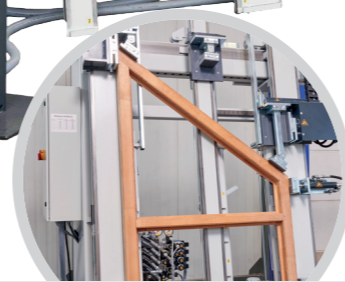
Dreieck-Studiofenster-Verpresseinrichtung Triangular studio window pressing