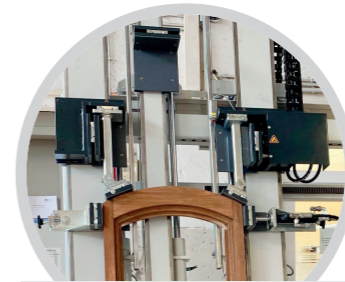
Rundbogenverpressung Assembly of arched frames