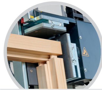
Eckverbindung Stemmzapfen Corner connection PlugTec