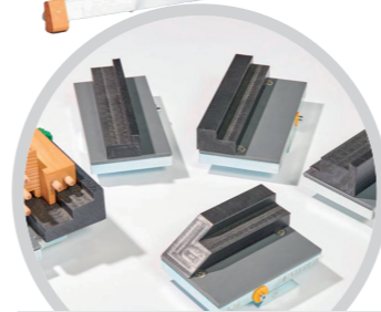
Konterprofilzulagen für außenprofilierte Flügel Counter blocks for outside profiled sashes