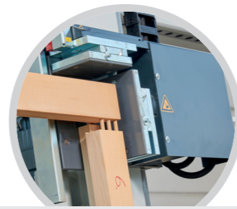
Eckverbindung Konter/Dübel Corner connection counter/dowel